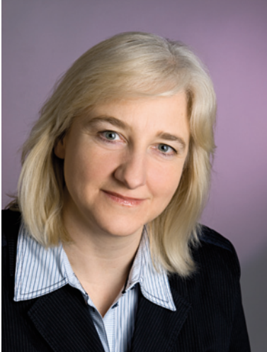
Eva Kühne-Hörmann, Hess. Ministerin für Wissenschaft und Kunst