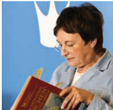
Darmstädter Bundestagsabgeordnete Brigitte Zyprie