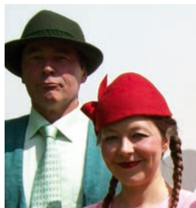
AktionsTheater Kassel, Rotkäppchen