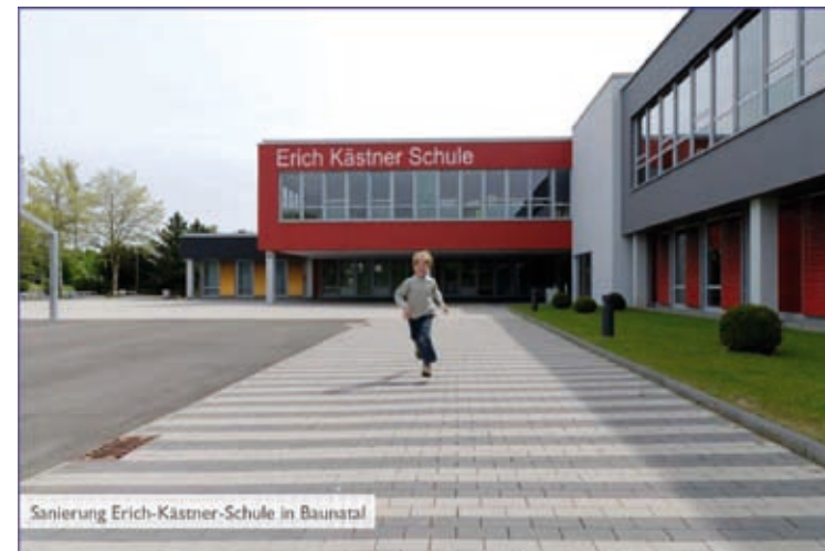
Sanierung Erich-Kästner-Schule in Baunatal

Dornröschenschloss Sababurg Märchentheater für alle ab 3 Jahren. Eintritt: 3 €