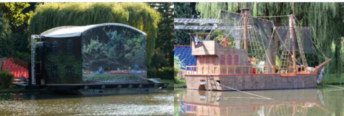
Die Bühne auf der Insel Siebenbergen, 2008 und 2009